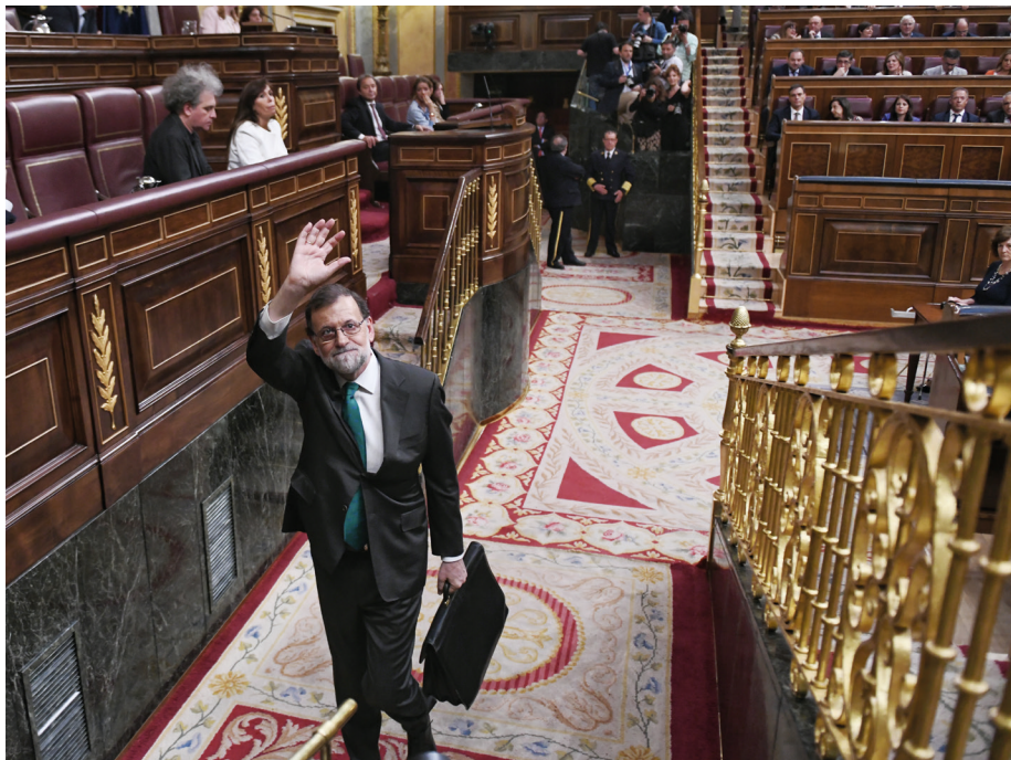
M. Rajoy abandona o hemiciclo dimpués de triunfar a moción de censura.

En chunyo de 2017, Unius Podemos esfendió a moción de censura d'a dignidat contra un tal M. Rajoy y un Partiu Popular empapaus de corrupción. Manimenos as decenas de casos de saqueo y parasitación d'o publico, a moción no salió entadevant y entre un anyo entero se repitió sin aturar que «no i heba numeros pa chitar a o PP d'a Moncloa».