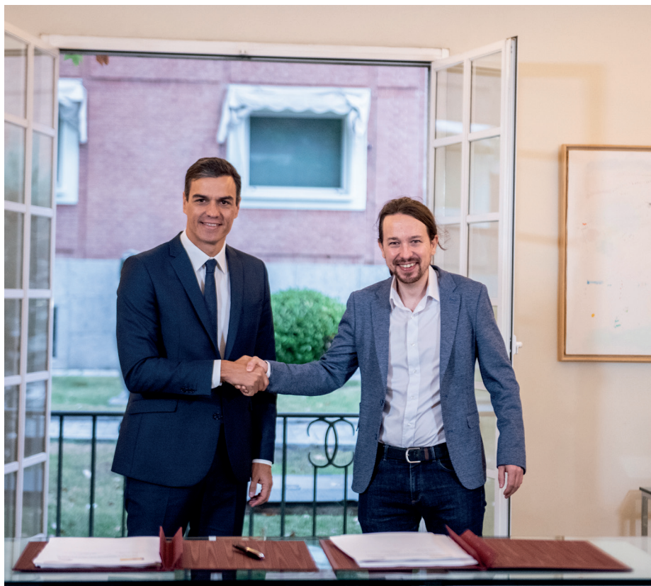
Pablo Iglesias i Pedro Sánchez tanquen l'acord pels pressupostos de 2019.

Acord pressupostari per a millorar la vida de la gent