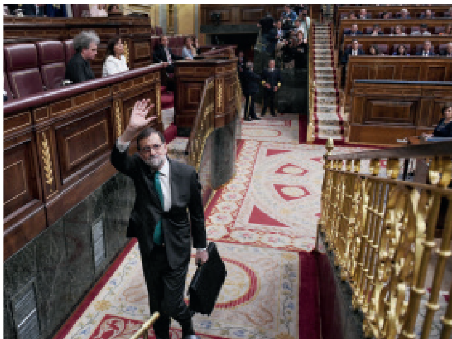
M. Rajoy hemiziklotik irteten, zentsura-mozioak garaipena lortu ondoren.

2017ko ekainean, Unidos Podemos alderdiak duintasunaren zentsura-mozioa babestu zuen, ustelkeriaz erabat bustitako M. Rajoyren eta Alderdi Popularraren aurkakoa. Arlo publikoaren arpilaketen eta bizkarroien dozenaka kasu agertu arren, mozioak ez zuen aurrera egin, eta urtebetez behin eta berriro errepikatu zuten PP Moncloatik botatzeko boto nahikorik ez zegoela.