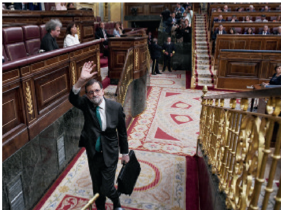
M. Rajoy abandona o hemiciclo tras triunfar a moción de censura.

En xuño de 2017, Unidos Podemos defendeu a moción de censura da dignidade contra un tal M. Rajoy e un Partido Popular empapados de corrupción. A pesar das decenas de casos de saqueo e parasitación do público, a moción non saíu adiante e durante un ano enteiro sen parar que «non había números para botar ao PP da Moncloa».