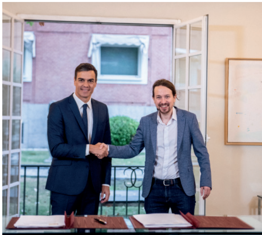
Pablo Iglesias e Pedro Sánchez pechan o acordo para os orzamentos de 2019.

Unidos Podemos arrinca un importante paquete de medidas sociais ao Goberno do PSOE