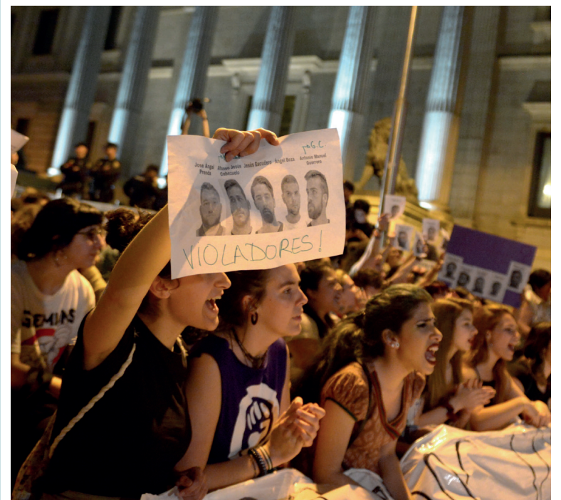
Movilización feminista en los alrededores del Congreso.

Además, en el acuerdo se ha logrado incrementar la duración de los contratos de alquiler a cinco años, más otros tres de prórroga, y se ha acordado crear un nuevo tipo de contrato para proteger al inquilino cuando el propietario sea un fondo buitre o un banco, que será de siete años, más tres de prórroga.