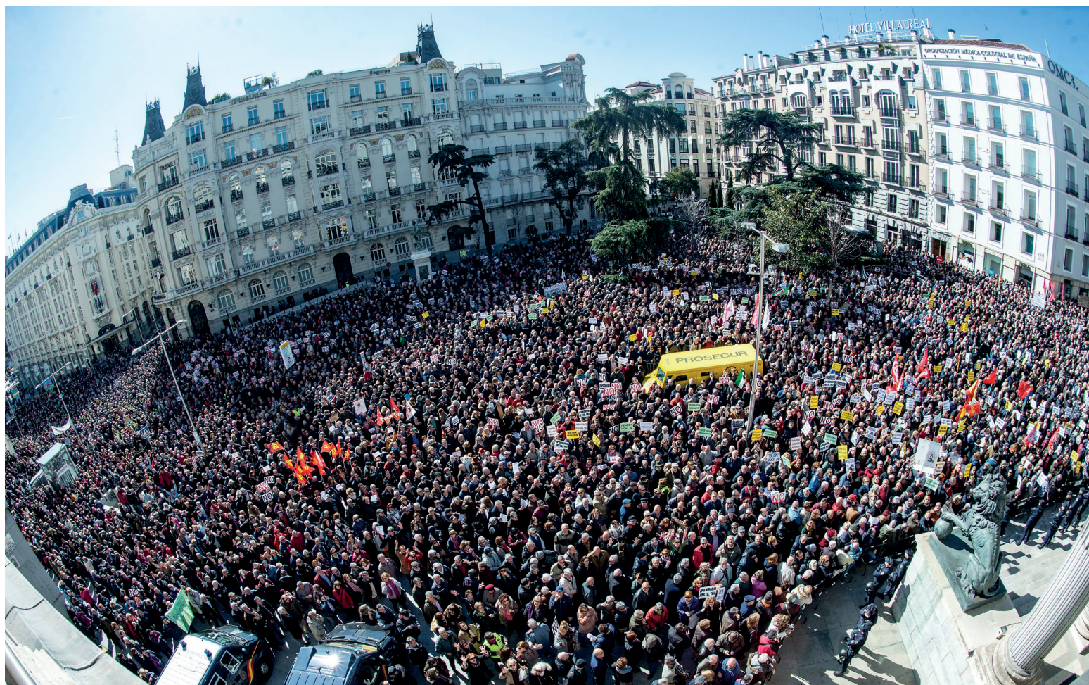
Concentración de protesta ante las puertas del Congreso.

El acuerdo ataca privilegios de las élites, que pueden acabar torciendo el brazo al PSOE