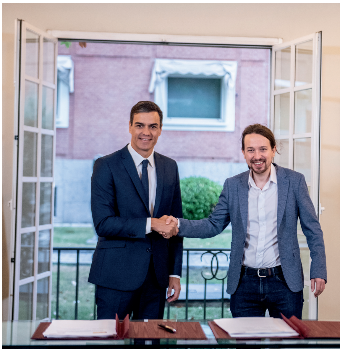
Pablo Iglesias y Pedro Sánchez firman en la Moncloa el acuerdo para los PGE 2019.

«Cuando Pablo Iglesias sea presidente del Gobierno, podremos desplegar de verdad nuestras propuestas. Estamos satisfechos con el acuerdo porque va a mejorar la vida de millones de personas, pero lo vemos como un paso intermedio. De