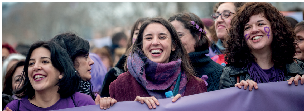
Manifestación feminista del 8 de marzo de 2018.

Se establecerán permisos de maternidad y paternidad iguales, intransferibles y con el 100% del sueldo durante 16 semanas