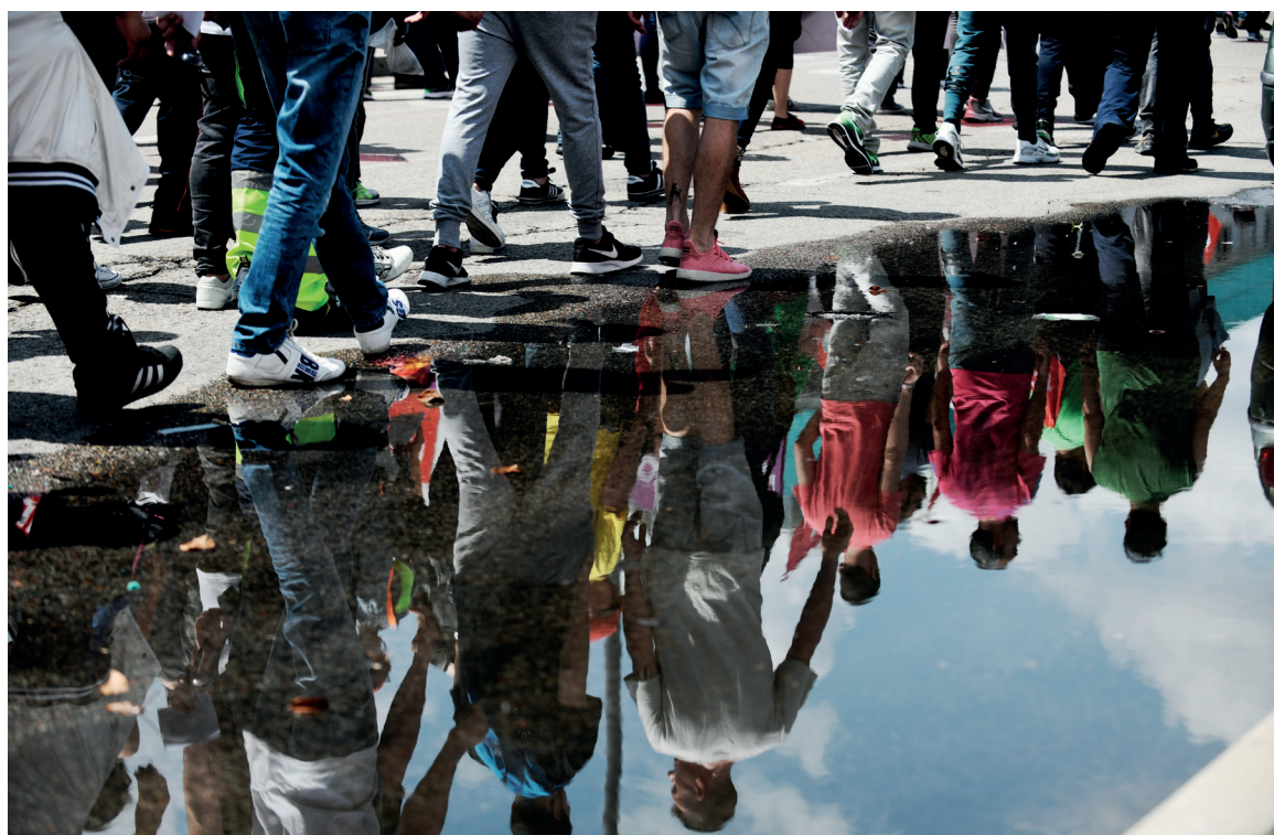
Huelga de los trabajadores y trabajadoras de Amazon.