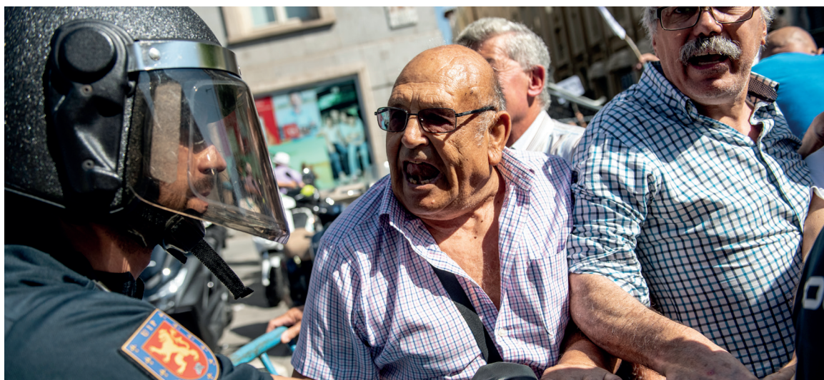
Movilización de pensionistas ante las puertas del Congreso.

Una paga única en enero de 2019 actualizará las pensiones al IPC real y lo mismo ocurrirá en 2020