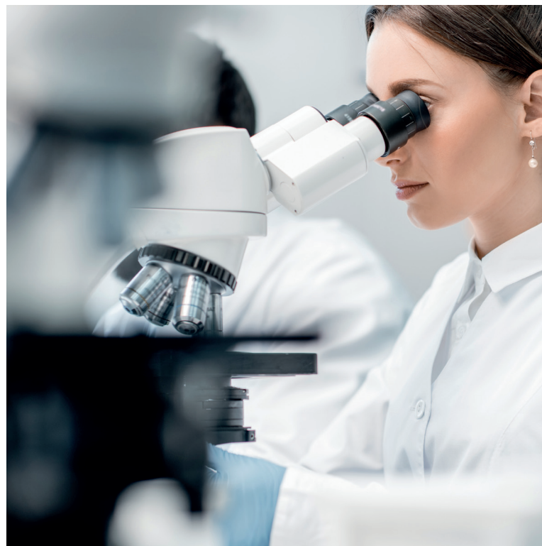
A pesar de que muchas mujeres empujan día a día por cerrarla, sigue abierta la brecha de género en la ciencia.

También mejorará de manera notable el estatuto de los y las investigadoras en formación, al establecer un salario mínimo o un máximo de carga docente.