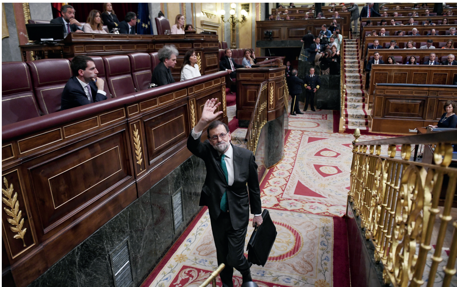
Mariano Rajoy abandona el hemiciclo en la sesión de la moción de censura del pasado mes de junio.