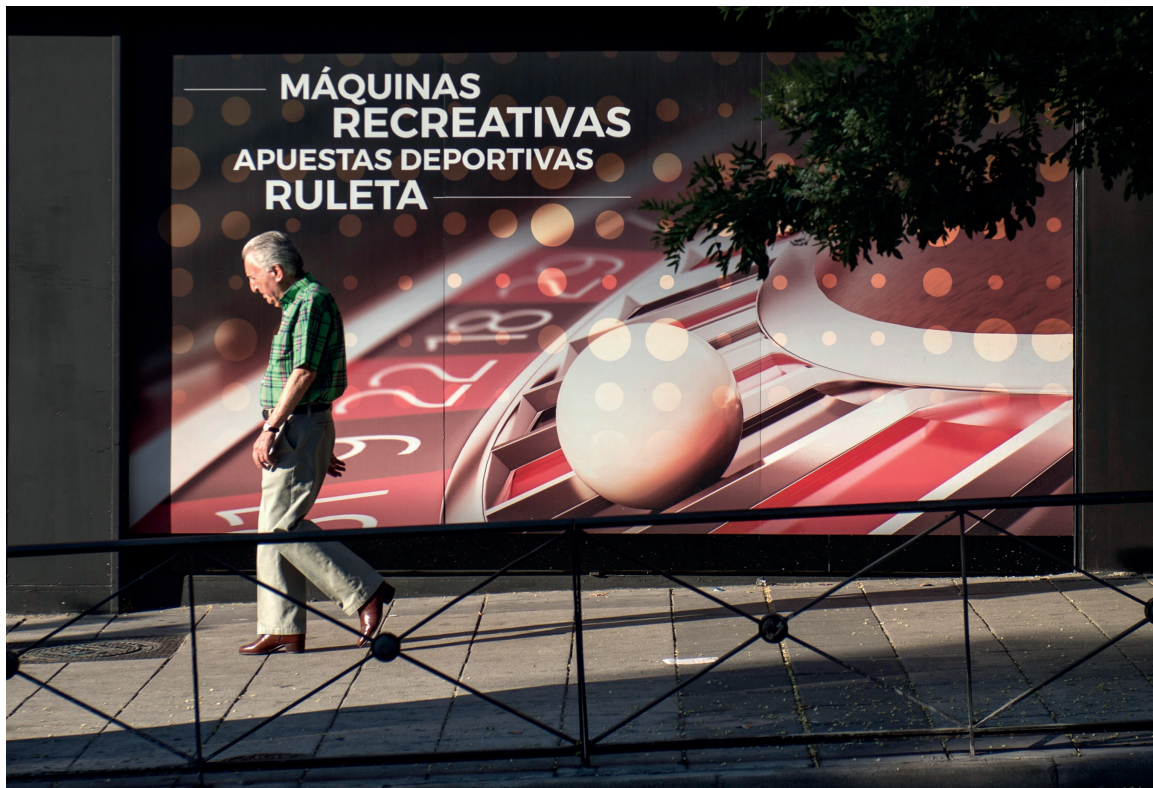
Vista de una casa de apuestas.

Medidas históricas tanto para prohibir la publicidad de las casas de apuestas y el juego online como para prevenir la adicción